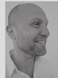
Diseño Stephen Philips de Arup