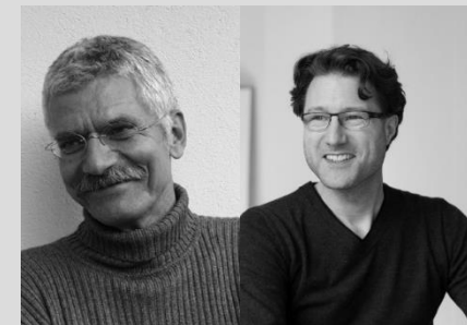
Diseño Burkhard Vogtherr & Markus Dörner