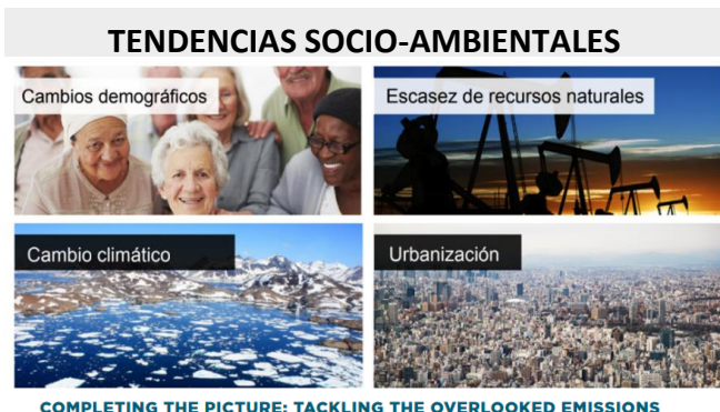
COMPLETING THE PICTURE: TACKLING THE OVERLOOKED EMISSIONS