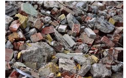
Reciclado de RCD- suelo cemento y grava cemento