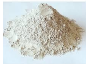
Polvo mineral de recuperación del propio proceso productivo de mezclas bituminosas