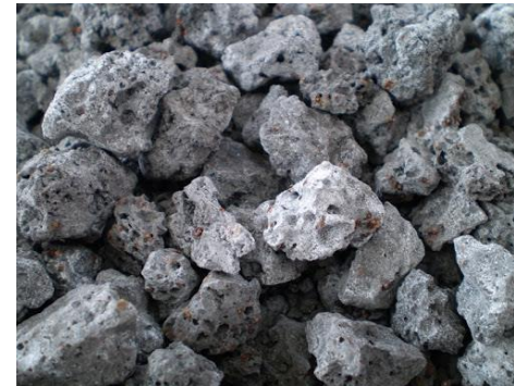
Árido siderúrgico de acerías de horno eléctrico