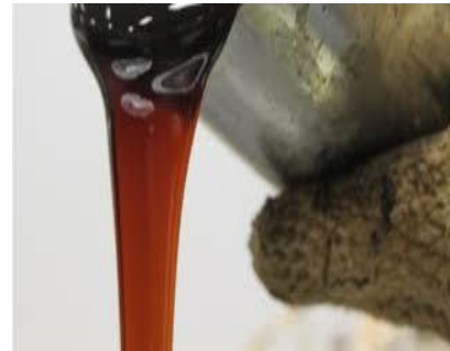
Bioligante: procedente de biomasa forestal