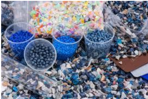
Reciclado de plásticos, (invernaderos, PET...)