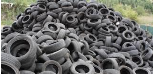
Polvo de neumático